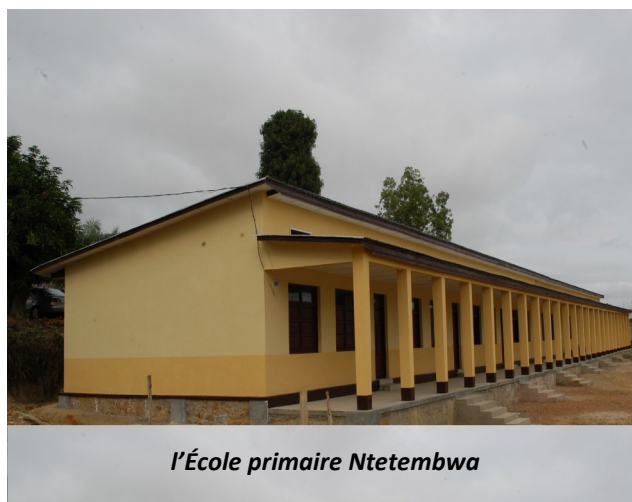
l'École primaire Ntetembwa