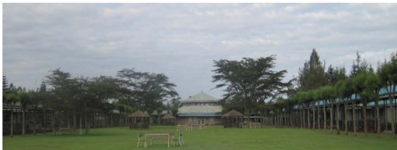
Centre de retraite Tabor Hill, Nyahururu, Kenya