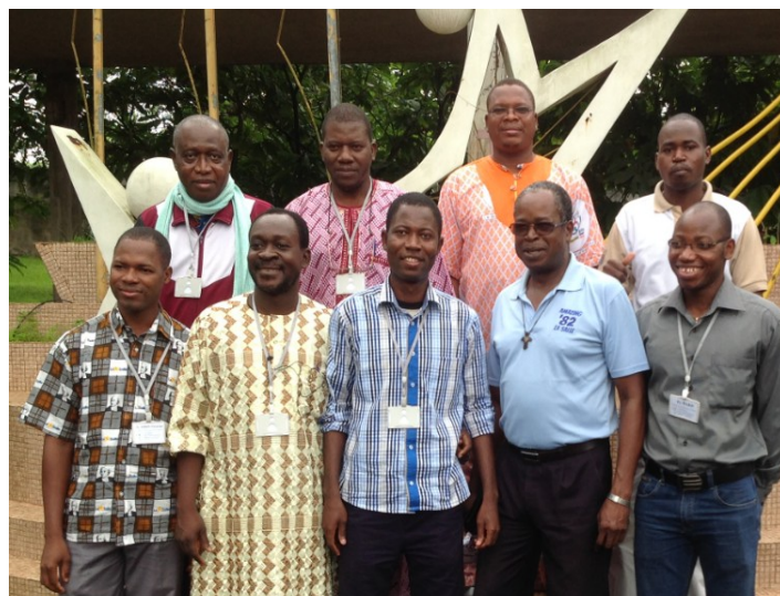
Participants du District d'Afrique de l'Ouest

En clair, loin de séparer, classer ou hiérarchiser, il faut envisager les dimensions constitutives de l'identité du Frère dans une approche intégrative. La Règle de 1987 l'exprime très clairement dans ses articles 10 : « Chaque Frère s'efforce d'intégrer dans sa personne les dimensions constitutives de sa vocation : la consécration à Dieu comme religieux laïc, le ministère apostolique d'éducation, spécialement auprès des pauvres, et la vie communautaire » et 81a, « L'effort d'intégration des éléments qui constituent la vie du Frère doit être engagé pendant la formation initiale, et poursuivi par la formation permanente ». Il n'y a plus aucun doute, l'exigence d'intégration de ces dimensions constitutives de la vocation du Frère est d'une nécessité capitale pour la lisibilité et la compréhension de celle-ci. Mais alors,