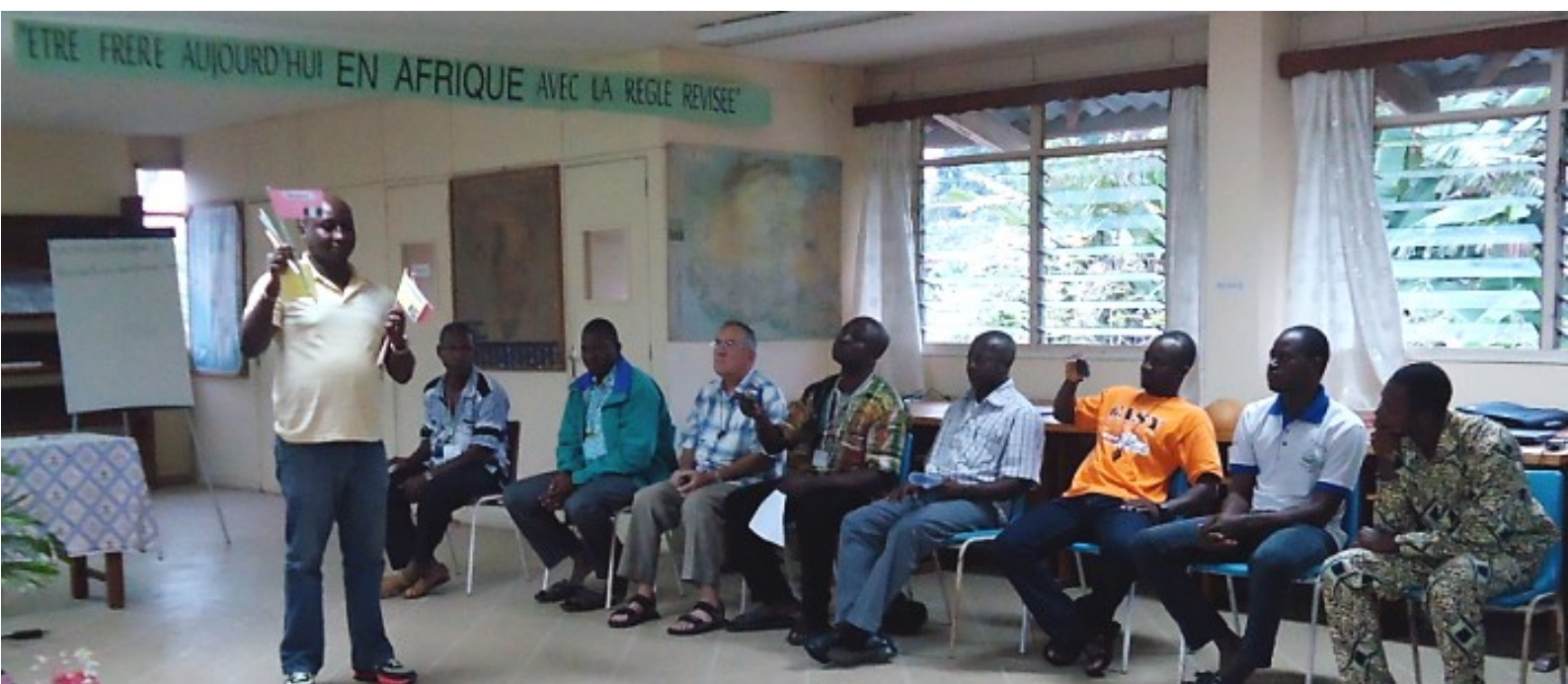
Photo prise lors de la cérémonie de clôture du CIL régional