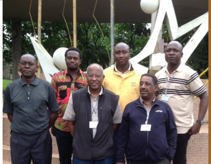
Participants du District de Lwanga

Mais un tel sentiment et degré de participation n'est assumée et vécue joyeusement que quand la communauté est véritablement le foyer de vie des Frères. La communauté entendue comme foyer de vie suppose qu'elle est le fruit d'une construction où chaque membre apporte sa pierre qui est aussi indispensable que celle des autres. La chaleur et la communion fraternelle résultent de l'effort de chaque membre de la communauté. Mais cette communauté doit être aussi une communauté de foi où l'on partage l'expérience de Dieu, une communauté imitatrice de l'unité et de la communion trinitaire, une communauté de prière, de l'écoute et de la méditation de la Parole de Dieu, une communauté où chaque Frère compte et bénéficie de l'attention des autres, une communauté où chaque Frère est engagé et pleinement conscient de la place de son témoignage dans la vie et l'engagement de la communauté.